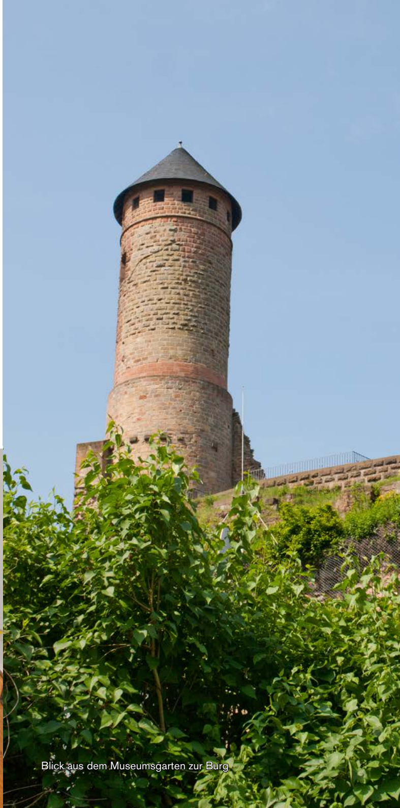
Blick aus dem Museumsgarten zur Burg

Die Replik der Ritterrüstung begeistert vor allem die jüngsten Besucher. Verschiedene Helme, ebenfalls Repliken, dürfen manchmal sogar anprobiert werden.