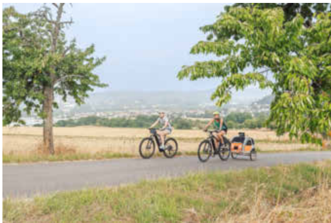
Radeln in der Biosphäre Bliesgau

Auch bei den Kultur- und Verkehrsämtern der kreisangehörigen Kommunen ist die Broschüre erhältlich.