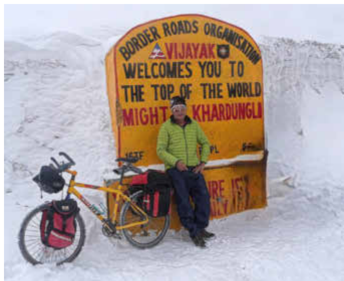
Khardung La: höchster befahrbare Pass der Welt

Sie erreichen das Sozialbüro der Gemeinde Kirkel unter folgender Rufnummer: 06841 / 8098-15. Natürlich können Sie sich auch problemlos per E-Mail an sozialbuero@kirkel.de wenden.