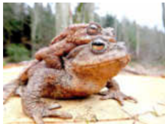
Abbildung von zwei Erdkröten

Der Marksweiher ist ein kleines stehendes Gewässer am Eingang des Taubentals im Kirkeler Wald, nahe der Autobahn A8 gelegen. Er hat keinen Zufluss, wird also nur durch Regenwasser gespeist und füllt sich jedes Jahr im Herbst und Winter neu.