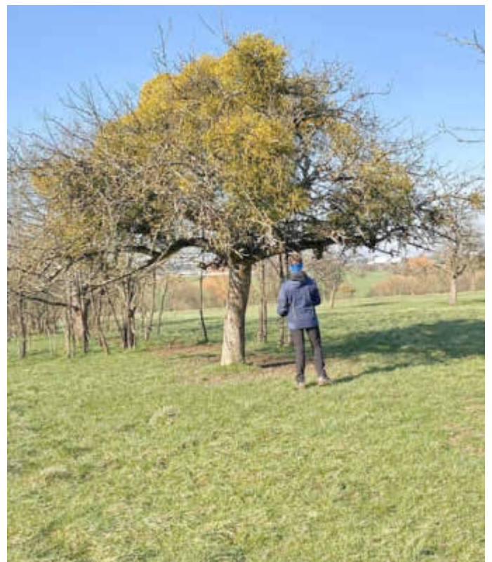
Bei der Erfassung der von Misteln befallenen Bäume bei Erfweiler-Ehlingen.

Selbstverständlich einhergehend mit der Bitte an die jeweiligen Grundstückseigentümer, diese Arbeiten zu unterstützen.