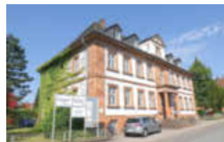
Die Koordinierungsstelle ist am Scheffelplatz 1 in Homburg zu finden.

Koordinierungsstelle Jugend und Arbeit des Saarpfalz-Kreises unterstützt junge Menschen bei Fragen zu beruflichen Perspektiven Spätestens mit Erhalt des Halbjahreszeugnisses fragen sich zahlreiche Schülerinnen und Schüler, wie es nach der Schule für sie weitergehen kann.