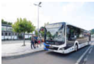
Mit dem ÖPNV unterwegs im Saarpfalz-Kreis.

Und zwar nicht nur beim Fahrgast, der nach geeigneten Verbindungen oder einem passenden Ticket sucht.