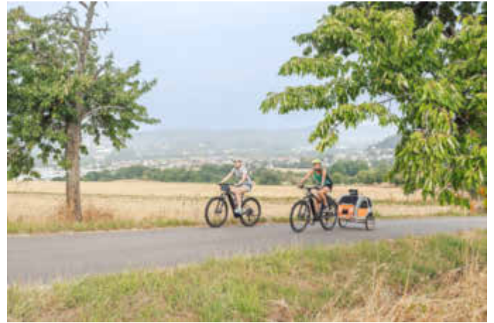
Radeln in der Biosphäre Bliesgau

Auch bei den Kultur- und Verkehrtägern der kreisangehörigen Kommunen ist die Broschüre erhältlich.