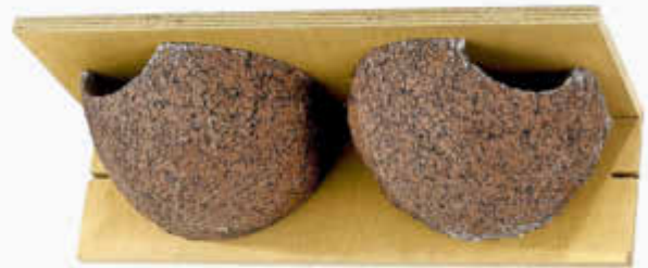
Nisthilfe für Mehlschwalben

Wenn Sie sich an der Schwalben-Aktion des NABU beteiligen möchten, melden Sie sich bitte bei Dieter Geib (Tel.: 06841 / 80404) oder über info@nabu-altstadt.de .