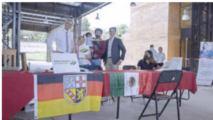
Begrüßung der mexikanischen Pflegefachkräfte

Aus organisatorischen Gründen ist eine Anmeldung erforderlich unter folgendem Link: https://www.gekommen-um-zu-pflegen.de/details-registrierung/finissage-bienvenida .