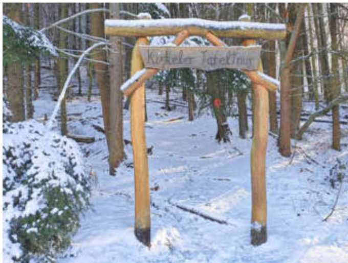
Kirkeler Tafeltour

E-Mail: touristik@saarpfalz-kreis.de ; Internet: www.saarpfalz-touristik.de .