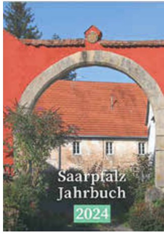
Titel des neuen Saarpfalz-Jahrbuchs mit einem Foto von Martin Baus

Freierei“ gingen - das sind einige der Themen des „Saarpfalz-Jahrbuchs“ für 2024.