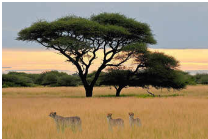
Gepardenfamilie in der Kalahari

Nähere Informationen finden Sie unter www.bildungszentrum-kirkel.de .