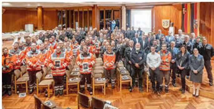
Bei der Verleihung der Fluthilfemedaille des Landes Rheinland-Pfalz im großen Sitzungssaal des Homburger Forums.

Fast 43.000 Einsatzkräfte aus Rheinland-Pfalz und dem gesamten Bundesgebiet erhalten für ihren Einsatz während und nach der Flutkatastrophe im Juli 2021 die Fluthilfemedaille des Landes. Anfang Februar hatte die Landesregierung die ersten Medaillen verschickt. In Rheinland-Pfalz erhalten insgesamt rund 25.000 Einsatzkräfte eine Fluthilfemedaille und eine dazugehörige Urkunde. Aus den anderen Bundesländern werden rund 18.000 Einsatzkräfte ausgezeichnet. Die Auszeichnung erhalten beispielsweise Helferinnen und Helfer der Feuerwehren, der Hilfsorganisationen, der Integrierten Leitstellen, der ADAC Luftrettung, der Psychosozialen Notfallversorgung sowie der Polizei. Einsatzkräfte des Bundes, etwa von THW, Bundeswehr und Bundespolizei, erhalten eine Würdigung seitens der Bundesregierung.