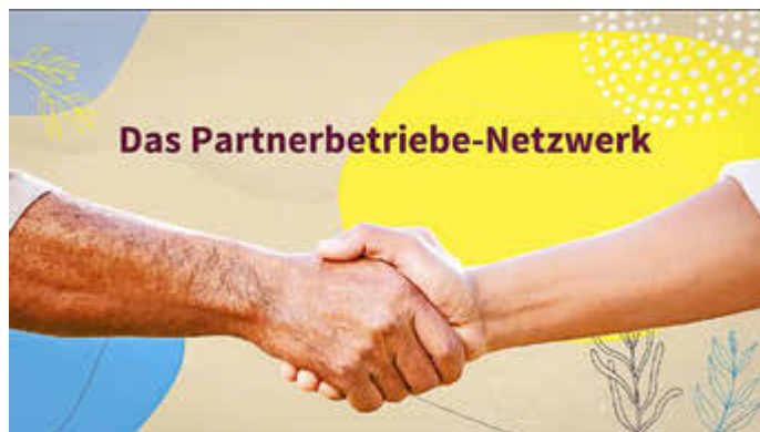
Ein starkes Netzwerk in der Biosphäre Bliesgau

Raumes (ELER) und 25 % aus Mitteln des saarländischen Ministeriums für Umwelt, Klima, Mobilität, Agrar und Verbraucherschutz. gez. Dr. Gerhard Mörsch Geschäftsführer