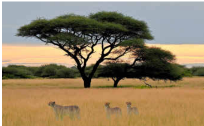
Gepardenfamilie in der Kalahari

Nähere Informationen finden Sie unter www.bildungszentrum-kirkel.de .