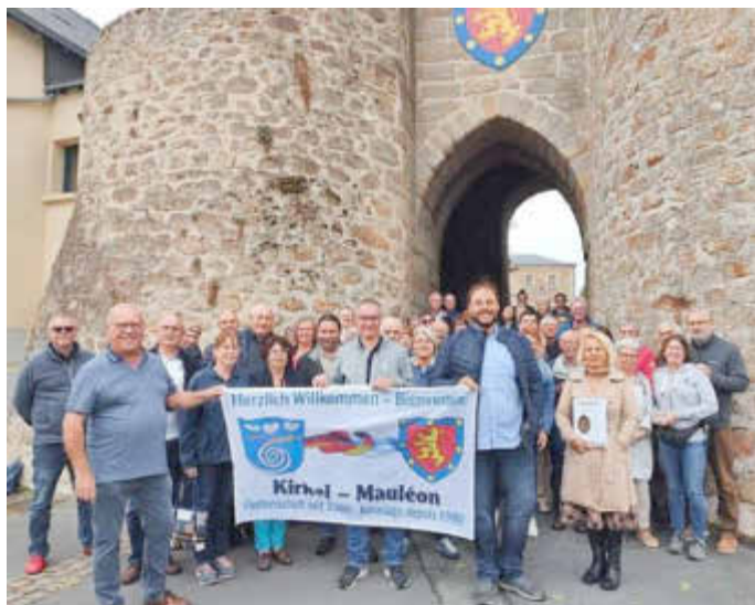
Gruppenfoto bei der historischen Führung am Samstag durch Mauléon vor dem Château

Neben den kulturellen Erlebnissen dieser Reise ist es ja vor allem unsere Gelegenheit, viele alte Freunde in Mauléon wiederzutreffen. Die herzlichen Umarmungen und fröhlichen Gespräche erinnerten uns schnell daran, wie wichtig diese Partnerschaft zwischen unseren Gemeinden ist.