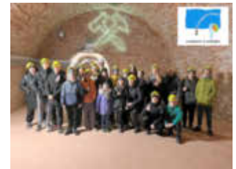
Im Rahmen der Ferienfreizeit für ukrainische Kinder und Jugendliche stand auch ein Ausflug in die Schlossberghöhlen in Homburg auf dem Programm.