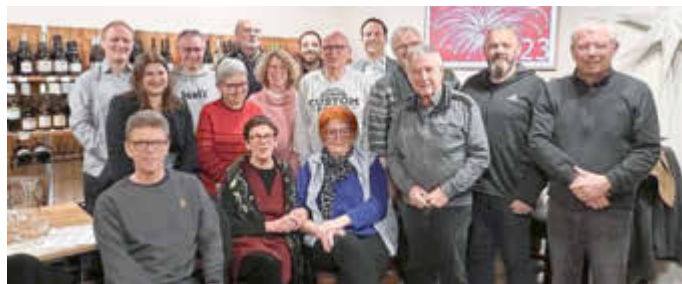
die neuen Vorstandsmitglieder

Nach den Wahlen wurden in gemütlicher Atmosphäre wichtige Themen im Ort besprochen. Mit der nächsten Vorstandssitzung, die mitgliederoffen ist, beginnt nach der Corona-Pause die Arbeit des neuen Vorstands. Zu der sehr angenehmen Sitzungsatmosphäre trug nicht zuletzt unser Versammlungsort bei.