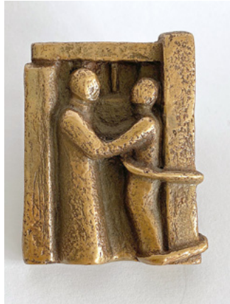
Die Bronzeplakette zeigt „Abbé Stock und der Gefangene“.