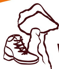
Ausblick Geiersteine-Tour

Tourist-Info-Zentrum Pfälzerwald Schuhmeile 1 · 76846 Hauenstein · Tel. 06392 9233380 www.urlaubsregion-hauenstein.de