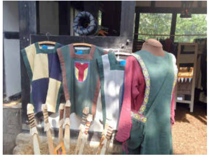
Werkstücke aus dem Projekt „Kirkeler Nähkästchen“

das Jobcenter Saarpfalz-Kreis gefördert. Träger des Projekts ist die Gesellschaft für Arbeit und Qualifizierung im Saarpfalz-Kreis mbH - kurz AQuiS GmbH - der kommunale Beschäftigungs- und Qualifizierungsträger des Saarpfalz-Kreises.