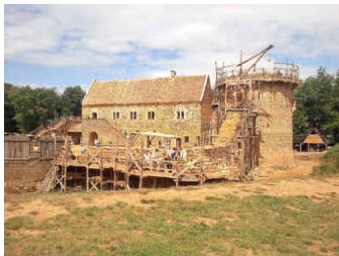
Errichtung der Burg Guédelon

Diese experimentelle Archäologie bietet den Besuchern die Möglichkeit, mehr über das Leben im 13. Jahrhundert zu lernen und ist eine faszinierende Möglichkeit, Geschichte lebendig werden zu lassen und die Vergangenheit hautnah zu erleben.