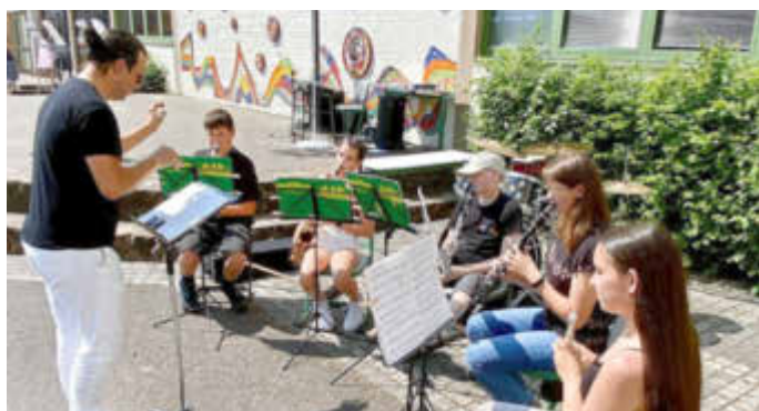
Auftritt der Musikgruppe der Schule