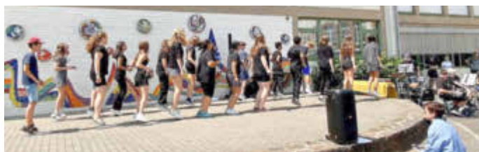
Tanzauftritt am Schulfest