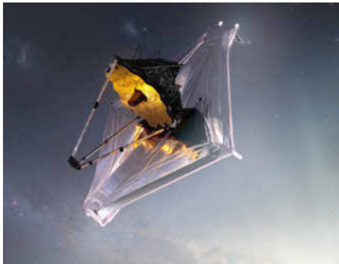
Abbildung des James-Webb-Weltraumteleskop der NASA, eine Partnerschaft mit der Europäischen Weltraumorganisation (ESA) und der Kanadischen Weltraumorganisation (CSA)

Die Öffnungszeiten der Ausstellung sind am 11. Juli von 13 Uhr bis 17 Uhr, vom 12. bis zum 14. Juli von 10 Uhr bis 17 Uhr, am 15. und 16. Juli von 10 Uhr bis 15 Uhr und am 17. Juli von 10 Uhr 17 Uhr. Gruppen und Schulklassen melden sich bitte unter Tel.: 06842 / 9243-10 oder per E-Mail an kvhs@saarpfalz-kreis.de an.