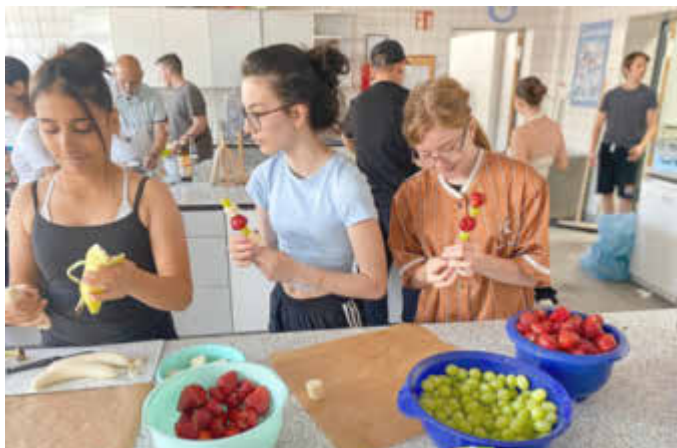
Vorbereitungen für das Schulfest