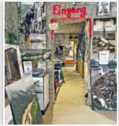
... die außer vielen Bildern auch mehrere Filmsequenzen beinhaltet.

AHRTAL. AFi. Auch fast zwei Jahre nach der verheerenden Flut ist das Ausmaß der Schäden entlang der Ahr weiterhin gegenwärtig. An vielen Stellen sieht es auf den ersten Blick noch immer nicht danach aus – doch es geht voran. Inhaber von Hotels, Restaurants und Geschäften haben, samt ihrer Mitarbeiter*innen, unzählige Stunden Arbeit, verbunden mit viel Hoffnung und Mut, in den Wiederaufbau ihrer geschäftlichen Existenzen gesteckt. Das Ziel: Endlich wieder zahlreiche Tages- und Übernachtungsgäste sowie Kundinnen und Kunden begrüßen zu können. Wanderfreudige Besucher*innen des Ahrtals dürfen sich, neben unvergesslichen Stunden in grandioser Natur entlang