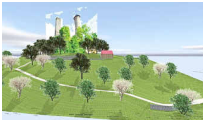
3D-Modell: Zuwegung

Die Kirkeler Burg und die Veranstaltungsreihe des Kirkeler Burgsommers sind über die Grenzen des Saarlandes hinweg ein fester Begriff und das Leuchtturmprojekt in unserer Gemeinde.