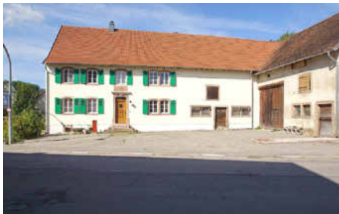
Stilgerecht renovierte Bauernhäuser sind Aushängeschilder der Region, identitätsstiftend und ortsbildprägend.

Weitergehende Informationen zum Bauernhauswettbewerb 2023, insbesondere zu den Wettbewerbsbedingungen, Terminen und Anmeldeadressen, gibt es im Internet im Online-Themenportal „Ländliche Entwicklung“ des Ministeriums für Umwelt, Klima, Mobilität, Agrar und Verbraucherschutz. Dort kann auch die 2020 vom Ministerium neu aufgelegte „Saarländische Bauernhausfibel“ kostenlos bestellt oder heruntergeladen werden. Die Fibel bietet viele wertvolle Anregungen und Hinweise für die Restaurierung saarländischer Bauernhäuser.