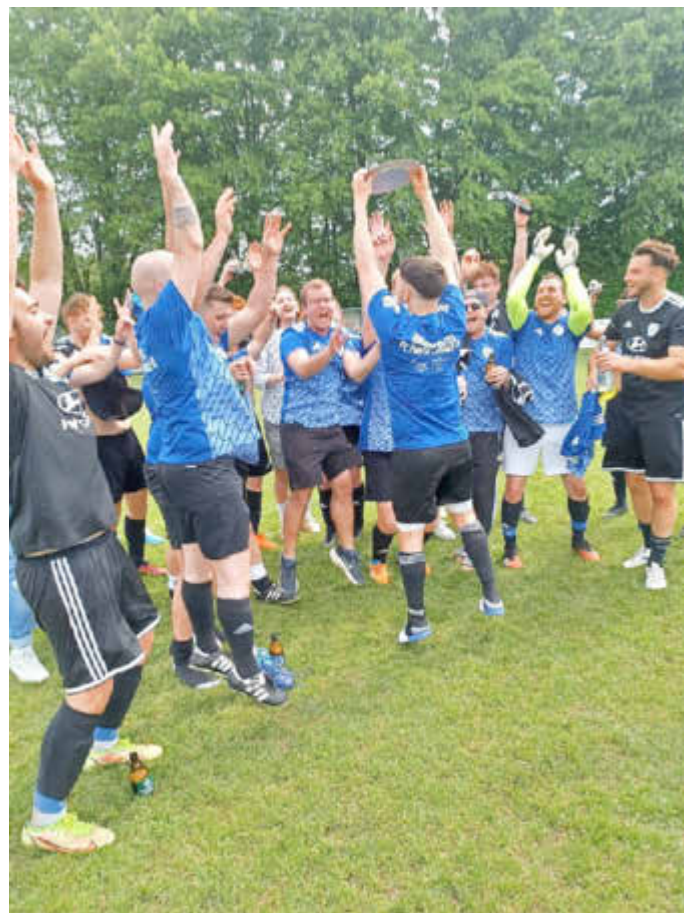
Jubel beim Limbach 3 als Meister der Kreisliga

die Voraussetzungen zum nun greifbaren Klassenerhalt. Also, liebe Palatia-Fans: Am Sonntag ein letztes Mal vor der langen Sommerpause unsere Jungs anfeuern und hinterher gebührend feiern! In der Landesliga haben die Männer um Coach Weinmann indes den Klassenerhalt schon seit Wochen in der Tasche und spielen nach wie vor eine tolle Saison. Zum Abschluss geht es ebenfalls am Sonntag in das Blietal. Limbach 3 hat das letzte Saisonspiel schon hinter sich gebracht und konnte nach dem Heimspiel gegen den SV Einöd die Meister-Schale in Empfang nehmen.