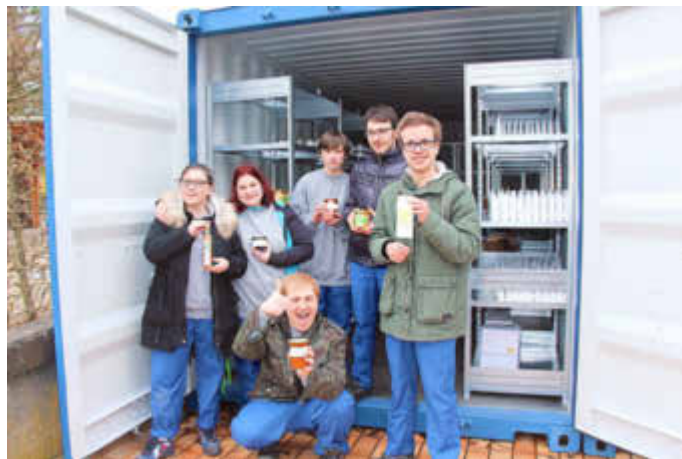
Junge Auszubildende des CJD mit Spaß bei der Arbeit