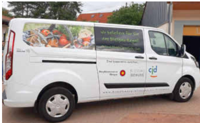
Das CJD beliefert das Bliesgau-Regal.

Geschäftsführer Biosphärenzweckverband Bliesgau