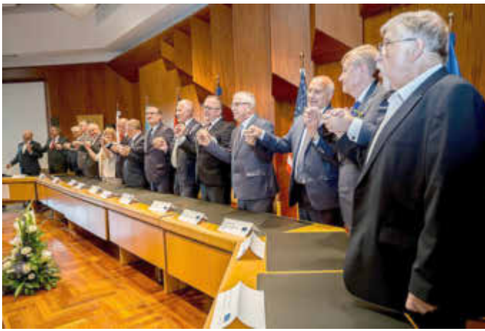
Bei der Gründungsveranstaltung zum „Internationalen Bündnis für Frieden und Zusammenhalt in Europa“ am 4. Juli 2022 im Homburger Forum.