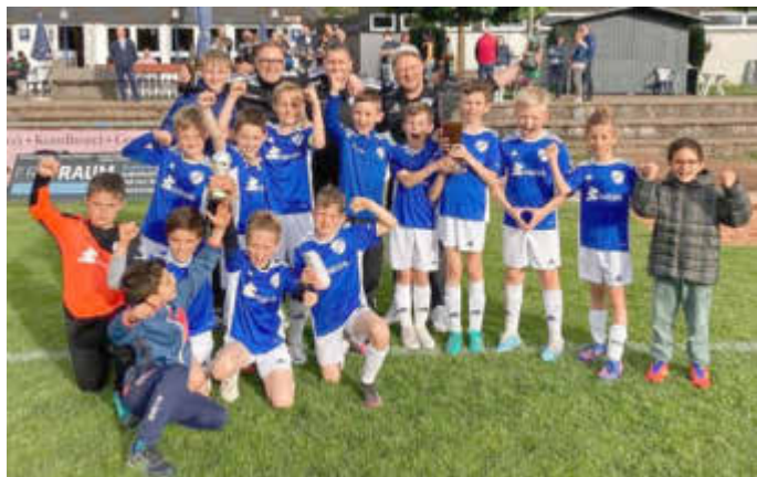
Das Meisterteam nach dem Sieg in Rohrbach

Hierzu gratulieren wir der Mannschaft und dem Trainer-Team ganz herzlich!