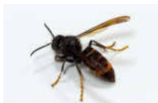
Die Asiatische Hornisse Vespa velutina