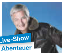
Live-Show Abenteuer Weltumrundung