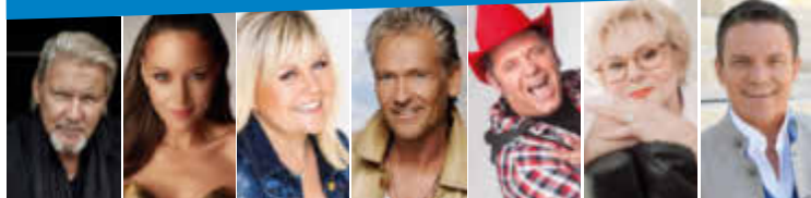
Johnny Logan, Jasmin Wagner/Blümchen, Gaby Baginsky, Olaf Berger, Markus Becker, Peggy March und Stefan Mross