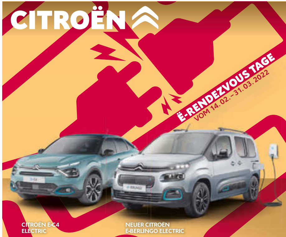
CITROËN ë-C4 ELECTRIC