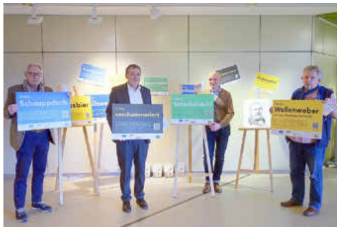
Vorstellung der Plakataktion in der Kreisverwaltung.

Weitere Infos bei Beate Ruffing, DAF Saar-Pfalz, 06841 / 104-8215, beate.ruffing@saarpflaz-kreis.de , www.dai-saarland.de .