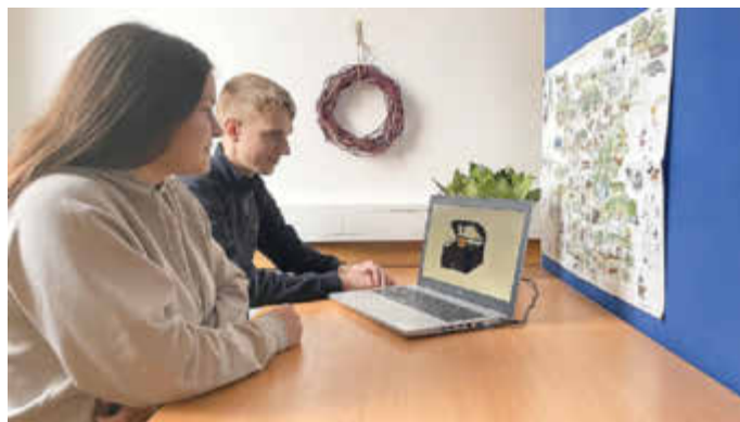
Die Biosphäre Bliesgau kommt nun auch digital in die Schulen.