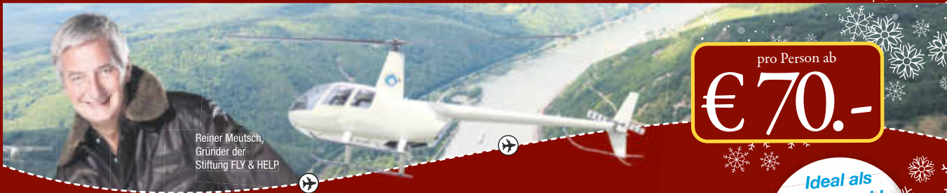
Reiner Meutsch, Gründer der Stiftung FLY & HELP