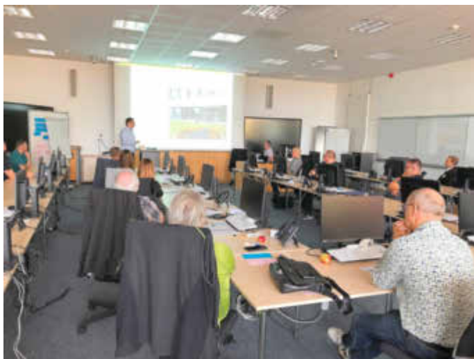
Blick in den gemeinsamen Krisenstab von St. Ingbert und Kirkel