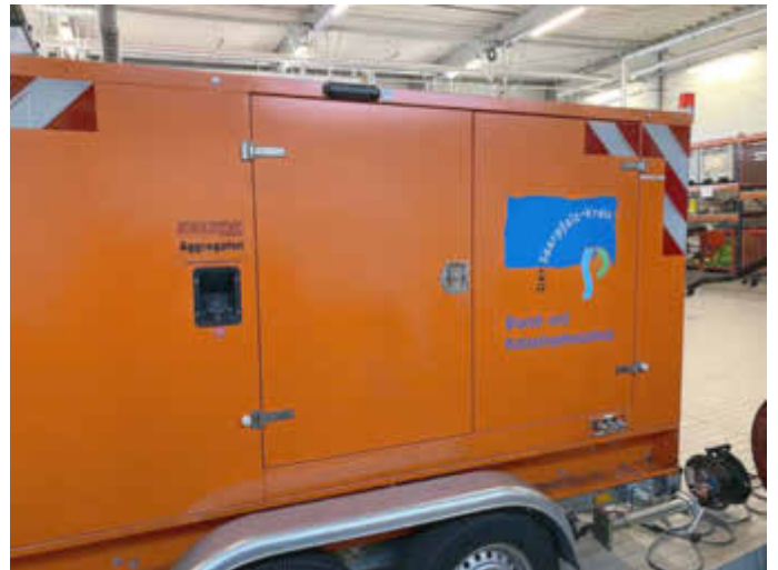
Das neue Notstromaggregat für den Saarpfalz-Kreis.

www.bkk.bund.de/DE/Warnung-Vorsorge/Vorsorge/vorsorge_node.html