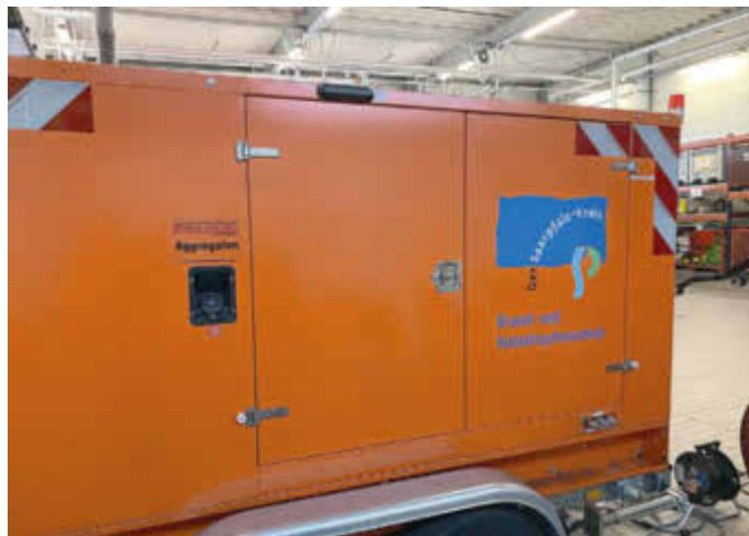
Das neue Notstromaggregat für den Saarpfalz-Kreis.

Seit vielen Jahren beschäftigt sich die Untere Katastrophenschutzbehörde im Saarpfalz-Kreis mit dem Thema Stromausfall.