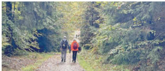
Wandergruppe auf dem Westwall Weg im Kirkeler Wald unterwegs

Weitere Informationen über Wandern und zur „Qualitätsregion Wanderbares Deutschland“ erhalten Sie bei der Saarpfalz-Touristik, Paradeplatz 4, 66440 Blieskastel, Tel.: 06841 / 104-7174, E-Mail: touristik@saarpfalz-kreis.de .