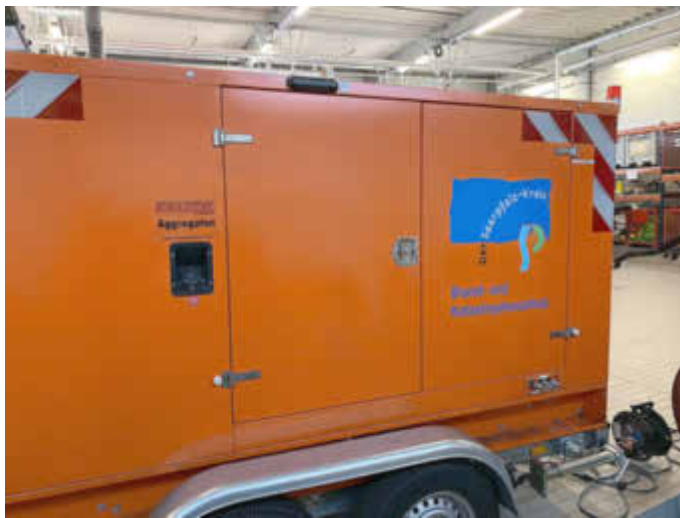
Das neue Notstromaggregat für den Saarpfalz-Kreis.

www.bbk.bund.de/DE/Warnung-Vorsorge/Vorsorge/vorsorge_node.html .