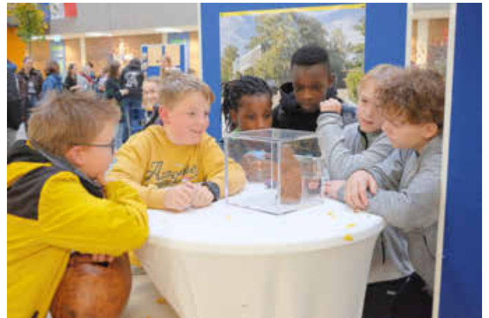
Treffpunkt Schulfest Johanneum

Das war aber dann auch schnell gemacht, denn das neue Schulfestkonzept sparte 75% Müll ein gegenüber den Vorgängermodellen. Der Erlös des Schulfestes fließt in „LED statt Neon“- für die Beleuchtung der Klassensäle und damit ist das Johanneum als christliche Schule wieder ein Stückchen seinem Ziel näher, nämlich: „Schöpfung bewahren!“