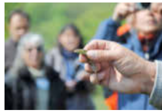
Das Kennenlernen der heimischen Tier- und Pflanzenwelt ist Teil der Ausbildung.

Der Lehrgang ist teilweise über Saarland-Sporttoto gefördert, teilweise aber auch kostenpflichtig: Es fallen 350,- € Teilnahmegebühr und 50,- € Prüfungsgebühr an. Anmeldeschluss ist der 15. Februar 2022, die Teilnehmerzahl ist begrenzt. Das Formular zur Bewerbung und die BANU-Richtlinien finden Interessierte auf der Internetseite www.vhs-igb.de/1.0444 .