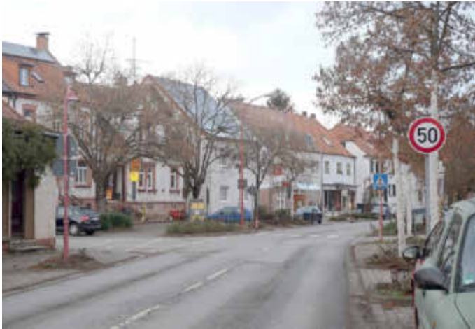
Aus 50 werden 30: Die Streckenbegrenzung auf 30km/h wird in der Limbacher Hauptstraße ab der Einmündung „Ludwigsthaler Straße“ bis zur Einmündung „Theobald-Hock-Platz“ erweitert.

Der Fachbereich Verkehrswesen beim Saarpfalz-Kreis hat die Streckenbegrenzung mit Tempo 30 km/h auf der Limbacher Hauptstraße (L114) erweitert. Landrat Dr. Theophil Gallo unterschrieb dieser Tage eine entsprechende Anordnung an den Landesbetrieb für Straßenbau. Bisher bezog sich die Streckenbegrenzung in der Ortsmitte von der Gemeinschaftsschule/früheren Post kommend bis zur Einmündung Ludwigsthaler Straße. Die Strecke wird nun bis zur Einmündung zum „Theobald-Hock-Platz“ nahe der Elisabethkirche ohne zeitliche Begrenzung ausgedehnt. „Bei einem Vororttermin mit Ansprechpartnern der Polizei, dem Landesbetrieb für Straßenbau und der Fachbereichsleiterin Verkehrswesen aus unserem Haus wurden Maßnahmen zur weiteren Verkehrssicherung erörtert. Diese werden zurzeit von allen Beteiligten geprüft“, erklärt Landrat Dr. Theophil Gallo.