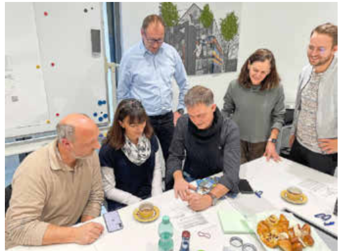
Unterzeichnung des Vertrages

Wer sein Kind an der Gemeinschaftsschule Kirkel in Limbach anmelden möchte, dem steht als Anmeldezeitraum die Zeit vom 09. bis zum 15. Februar zur Verfügung. Termine können über die Homepage ( www.gemeinschaftsschulekirkel.de ) gebucht werden. Kontakt zur Gemeinschaftsschule Kirkel, Hauptstraße 75 in 66459 Kirkel-Limbach gibt es auch telefonisch unter der Nummer 06841 / 980040 oder per E-Mail unter sekr.gems-kir@saarpfalz-kreis.de .