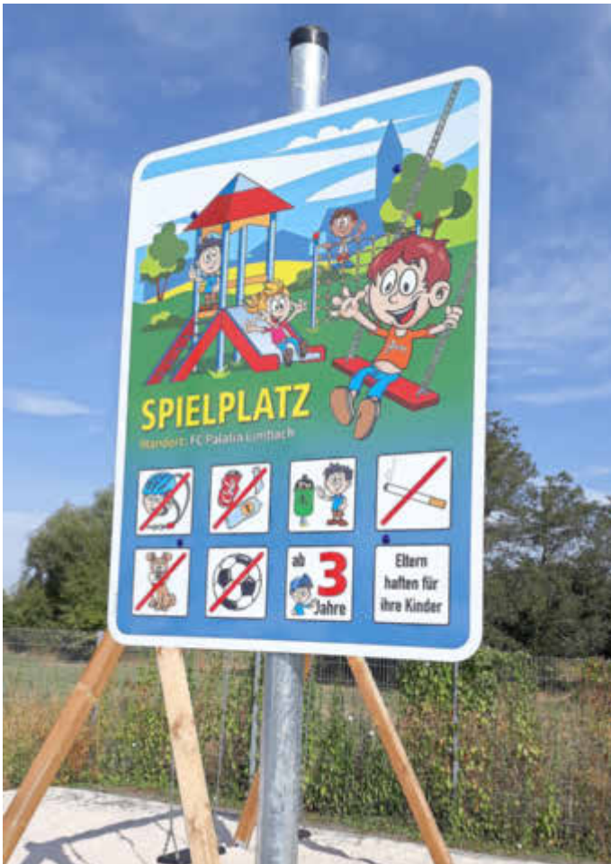
Wichtige Hinweise zur Nutzung

Wir bitten um Beachtung der Nutzungsbedingungen, die ab sofort auf einem Piktogramm unschwer zu erkennen und zu verstehen sind.