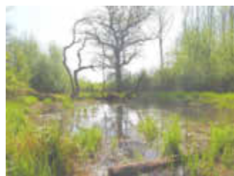
Biotop Mardelle Schwefelspfuhl im Medelsheimer Klosterwald

Der Zweckverband „Saar-Blies-Gau/Auf der Lohe“ lädt für Mittwoch, 14. September , ein, die faszinierende Landschaft des Bliesgaus kennen zu lernen.