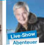
Live-Show „Abenteuer Weltumrundung“