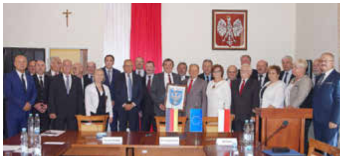
Im Rahmen einer Sondersitzung des Kreistages in Przemysl am 1. September 2017 wurde die Partnerschaft der Kreise neu beurkundet.