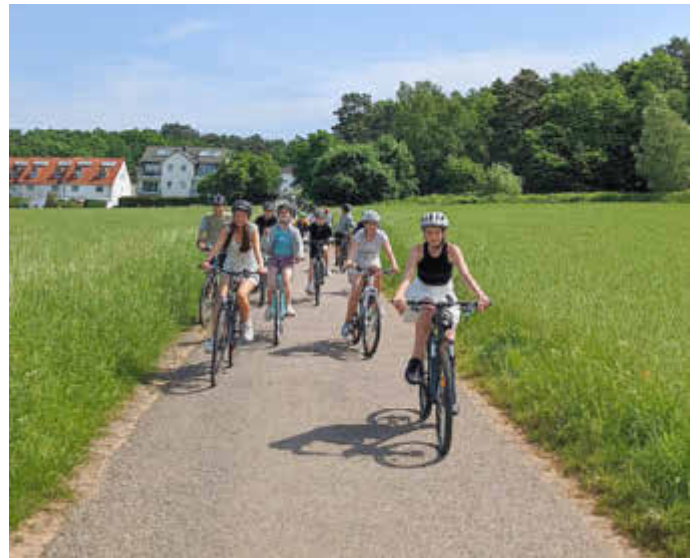
Radtour der Klasse 7a durch die Biosphäre Bliesgau