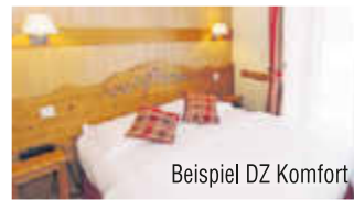
Beispiel DZ Komfort