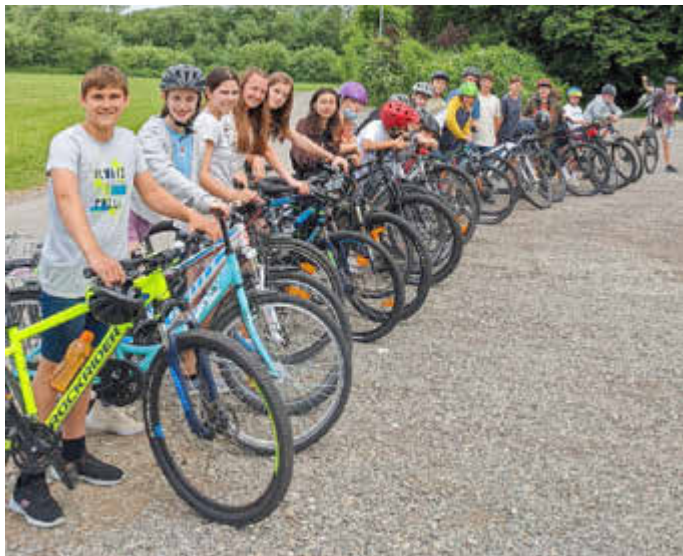
Radtour der Klasse 7a durch die Biosphäre Bliesgau