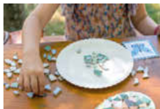
Basteln mit Mosaiksteinen im Kulturpark

Die Ferienfreizeit findet vom 29. August bis 3. September statt.