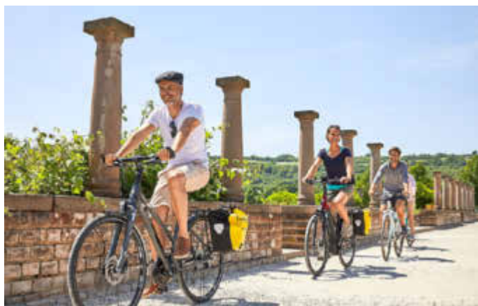
Auch von Reinheim aus führt der Bliestal-Freizeitweg nach Blieskastel.

Der Biosphärenmarkt findet am Sonntag, dem 3. Juli, von 11 bis 18 Uhr, rund um den Paradeplatz in der barocken Altstadt von Blieskastel, statt. Und da biosphärisch genießen ja immer auch klimafreundlich anreisen heißt, werden alle Besucherinnen und Besucher des Marktes gebeten, mit Bus oder Bahn, dem Fahrrad oder auf Schusters Rappen nach Blieskastel zu kommen.