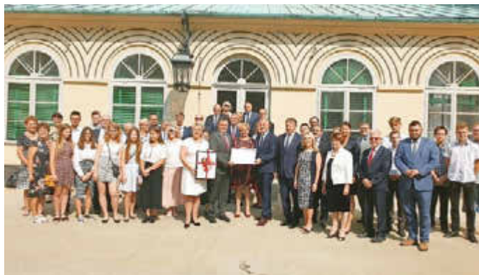
Nach der Unterzeichnung der Absichtserklärung zur Partnerschaft mit dem polnischen Landkreis Lancut im Innenhof des Schlosses Lancut im Jahr 2019

Zur Unterschrift für dieses Bündnis konnten neben den polnischen Partnerkreisen, ukrainischen Rajonen, dem amerikanischen County und dem Landkreis Neunkirchen auch die Präsidenten des Deutschen, des Polnischen und des Ukrainischen Landkreistages gewonnen werden, ebenso der Präsident von CEPLI, einer europäischen Dachorganisation der Landkreise acht europäischer Länder, sowie der Präsident von EUREGIO SaarLorLux+.