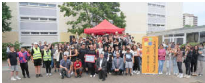
Bei der Spendenübergabe auf dem Schulhof der Gemeinschaftsschule Neue Sandrennbahn.

Wie der Schulleiter informierte, wurde das Fest recht kurzfristig geplant und durchgeführt. Es sei der Schulgemeinschaft ein Bedürfnis gewesen, aktiv zu werden und ein Zeichen der Solidarität mit den Menschen in der Ukraine zu setzen. „Dieses Friedens- und Freundschaftsfest hat der gesamten Schulgemeinschaft sehr gutgetan“, versicherte er und sprach beim Landrat das Interesse seiner Schule an, einmal einen Schüleraustausch mit dem Partnerkreis Lwiw (deutsch: Lemberg) zu organisieren, sobald es die Situation zulasse. Das hörte der Landrat natürlich gerne, sicherte hier seine Unterstützung zu und bedankte sich: „Sie alle haben mit dem Friedensfest ein wichtiges Signal gesetzt, das wir weitertragen werden. Die Menschen in der Ukraine spüren diese Verbundenheit. Ein Für- und Miteinander ist unglaublich wertvoll und macht vor allem Mut. Das ist in Zeiten wie diesen von unschätzbarem Wert.“