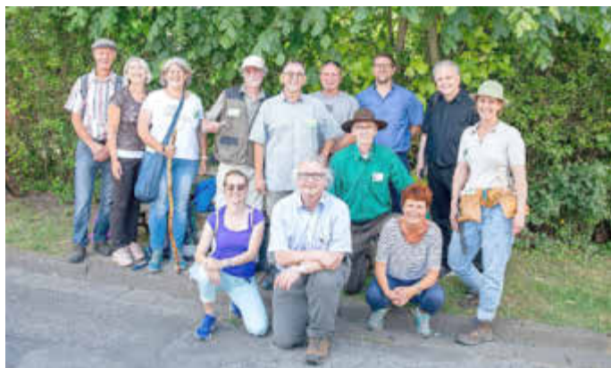
Zwei Prüfungstage, 20 erfolgreich zertifizierte Natur- und Landschaftsführer*innen, mit Vertretern der Prüfungskommission.

Ev. Frauenbund: Thea Bentz, Ortsstr., Tel. 06841 / 8393