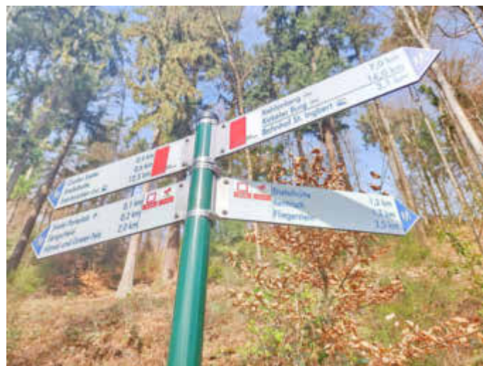
St. Ingbert Stiefel Wanderwegebeschilderung

Parallel wird eine Wanderkarte mit dem neuen Wegenetz produziert. Über die Fertigstellung des kompletten Wegenetzes mit wegweisender Beschilderung wird die Saarpfalz-Touristik rechtzeitig informieren. Weitere Informationen über Wandern und zur Wanderwegebeschilderung erhalten Sie bei der Saarpfalz-Touristik, Paradeplatz 4, 66440 Blieskastel, Tel.: 06841 / 104-7174, E-Mail: touristik@saarpfalz-kreis.de .