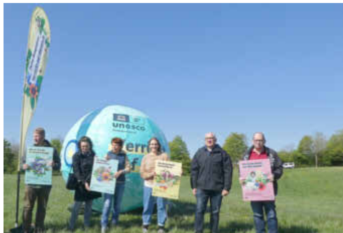
Vertreter*innen des Umweltministeriums, des Partnerbetriebe-Netzwerkes und des Biosphärenzweckverbandes stellen die Kampagne vor.