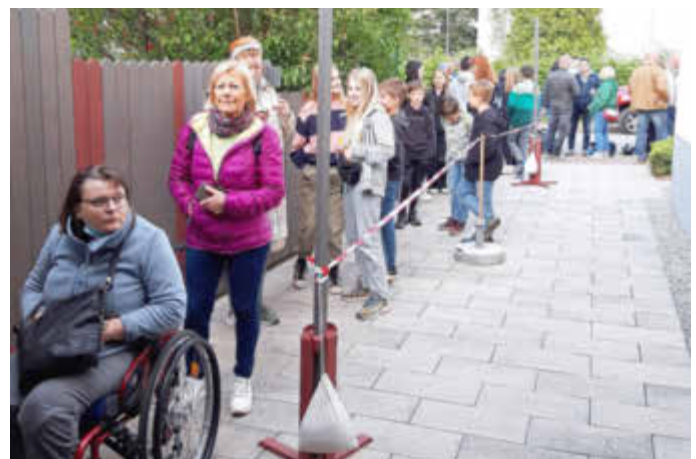
Eine Warteschlange mit guter Laune

Hexennacht-Crêperie erwirtschaftet 388,50 € für Bürgerbusverein