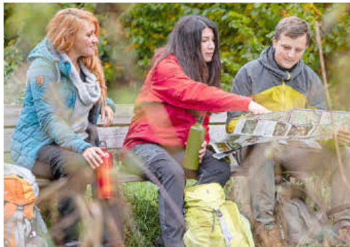
Hilfe bei Planung und Erfassung touristischer Rad- und Wanderwege. Foto: Touristische Infrastruktur © Eike Dubois / Saarpfalz-Touristik

Die vielfältigen Aufgabenbereiche sorgen hierbei für eine spannende Mischung aus praktischer Arbeit vor Ort und begleitender Büroarbeit. Darüber hinaus bietet die betreuende Stabsstelle „Nachhaltige Entwicklung und Mobilität“ auch Raum zur Verwirklichung eigener Projekte.