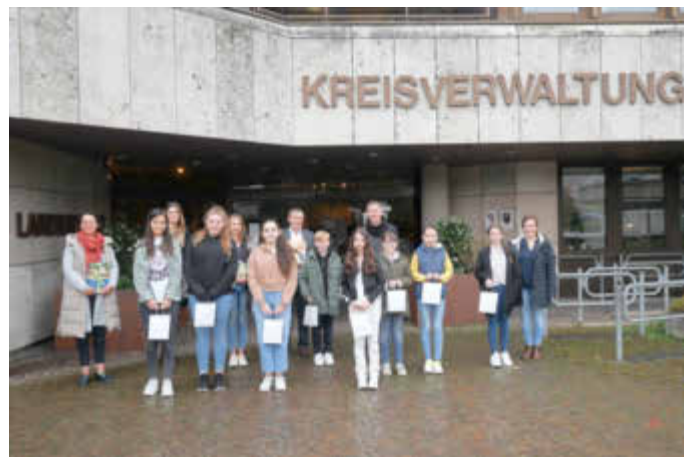
Bei der Spendenübergabe der Gemeinschaftsschule Kirkel.