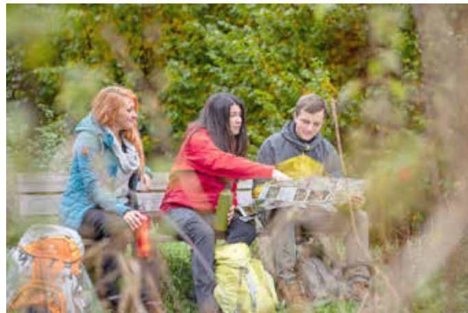
Hilfe bei Planung und Erfassung touristischer Rad- und Wanderwege

Weitere Informationen findet man auch beim Träger des FÖJ im Saarland, dem Ministerium für Umwelt und Verbraucherschutz.