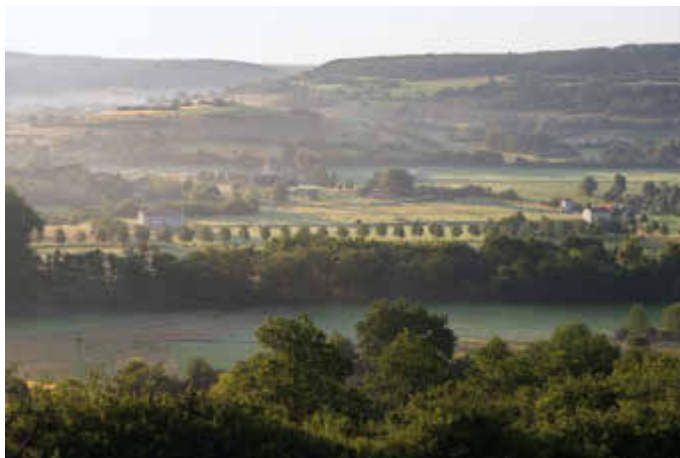
Blick auf den Europäischen Kulturpark Bliesbruck-Reinheim

Die aktuellen Coronamaßnahmen des deutsch-französischen Parks finden Sie auf der Homepage.