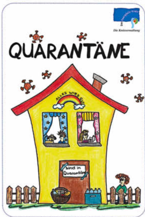
Hinweisblatt Quarantäneregeln für Kinder

Informiert wird über Themen wie Besuchsverbote, die AHAL-Regeln, das Benutzen von eigenem Geschirr und eigenen Handtüchern sowie das Teilen von Kuschtieren. Der Flyer steht auch als Download zur Verfügung in der Rubrik https://www.saarpfalz-kreis.de/leben-soziales-gesundheit/gesundheits/coronavirus