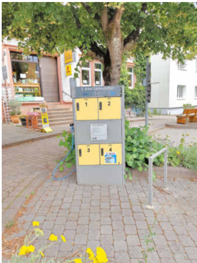
E Bike Ladestation in der Hauptstraße in Limbach

In der Winterpause wurden die E Bike Ladestationen in der Gemeinde Kirkel mit jeweils einem Bosch Ladegerät nachgerüstet. Dies bedeutet, dass in einem der Schließfächer ein Ladegerät für Bosch Akkus integriert ist. Zu erkennen sind die Schließfächer an einem Aufkleber. Umgesetzt wurde dieses Konzept in Zusammenarbeit mit der GIU Saarbrücken. Ein Bosch Ladegerät wurde deshalb ausgewählt, weil diese E Bike Motoren in Deutschland weit verbreitet sind. Außerdem kann das Bosch E Bike Ladegerät alle Bosch Akkus der Baujahre bis 2012 mit Performance Line, Performance Line CX und Active Line sowie Active Line Plus laden. Der Akku Typ wird automatisch vom Ladegerät erkannt und die Ladung entsprechend angepasst. Haftung für etwaige Schäden, die durch das Laden am Akku entstehen, werden nicht übernommen. Ansonsten geschieht der Ladevorgang, wie an den Stationen beschreiben.