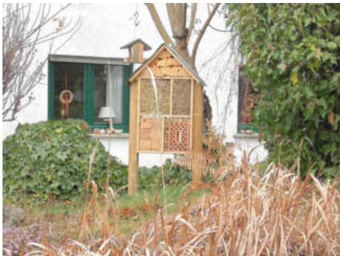
Idyllische Standplätze fanden viele der vom Eisbärenclub hergestellten Insektenhotels.

Während die Corona-Pandemie die Naturschutz-Aktivitäten der Eisbären wenig einschränkt, fiel im vergangenen Jahr eine Feier aus erfreulichem Anlass ins Wasser: Das 40-jährige Bestehen des 1980 gegründeten Clubs konnte nicht wie vorgesehen gefeiert werden. Eine zünftige „Nachholpartie“ sobald es die Umstände erlauben, wird aber nicht aus den Augen verloren.