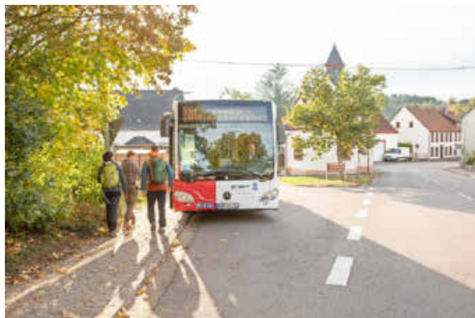
Mit dem Bus unterwegs in der Biosphäre Bliesgau.

Informationen zur Biosphären-Safari finden Interessierte unter: https://www.saarpfalz-touristik.de/planen-buchen/tagesangebote/biosphaeren-safari sowie unter https://www.mobilikon.de/praxisbeispiel/biosphaeren-safari-einmobilitaets-marketing-produkt .