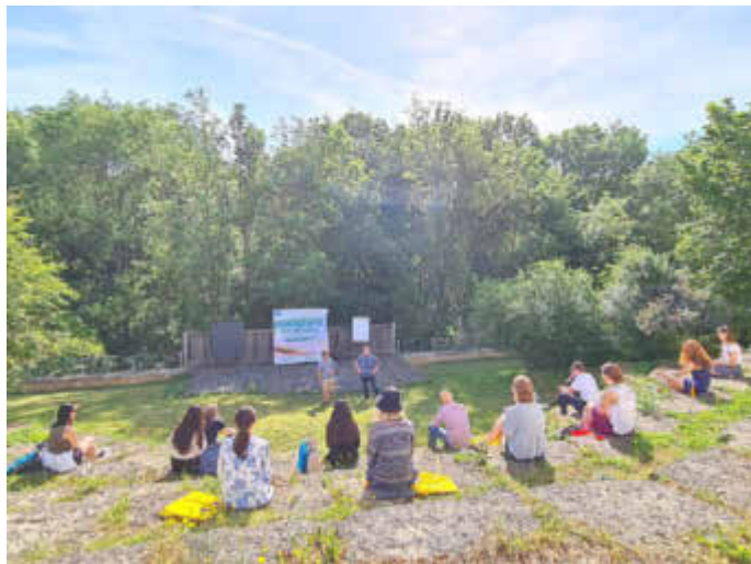
Fortbildung mit Jugendlichen im Rahmen von „Demokratie leben“ im Ökolog. Schullandheim Spohnshaus in Gersheim.

Weitere Informationen zum Gesamtprojekt erhalten Interessierte auch unter www.demokratie-leben.de