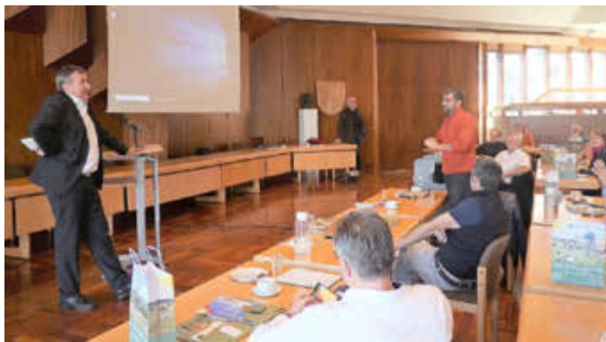
Bei der Begrüßung im großen Sitzungssaal im Homburger Forum.