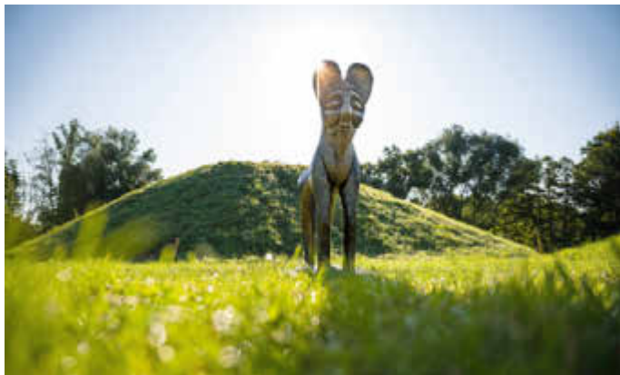
Deckelfigur vor den Grabhügeln.

Die Anmeldung sollte bis spätestens Montag, den 18. Oktober, um 12 Uhr erfolgen.