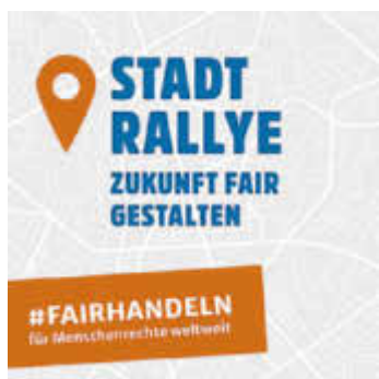
Kampagnen-Logos Stadtrallye „Zukunft fair gestalten“

Vom 10. bis zum 24. September können Interessierte auf Entdeckungstour gehen und an sechs Stationen Hintergründe zum fairen Handel, zur Fairtrade Stadt Homburg und zum Fairtrade Saarpfalz-Kreis erfahren und dabei gewinnen. Es geht darum, in einem Rallye-Pass Fragen zu beantworten, die sich um fair gehandelte Produkte und die Lebens- und Arbeitsbedingungen im Globalen Süden drehen. Die Tour ist Teil der Aktionswoche des Fairen Handels vom Forum Fairer Handel, dem Weltladen-Dachverband und Fairtrade Deutschland mit bundesweit rund 2.000 Aktionen jährlich.