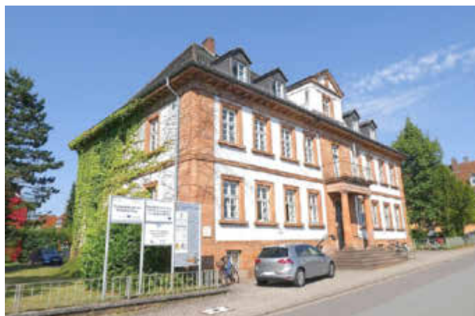
Die Koordinierungsstelle ist am Scheffelplatz 1 in Homburg zu finden.

Das Büro befindet sich am Scheffelplatz 1 in Homburg. Außensprechstunden bietet Claudia Möller nach Vereinbarung auch im Rathaus St. Ingbert, Am Markt 12, an.