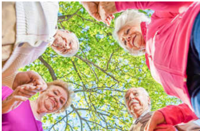
Gemeinsames Bewegungsangebot älterer Menschen unter freiem Himmel

Anmeldung und weitere Informationen beim Gesundheitsamt des Saarpfalz-Kreises, Sozialer Dienst, Telefon: 06841 / 104-7242