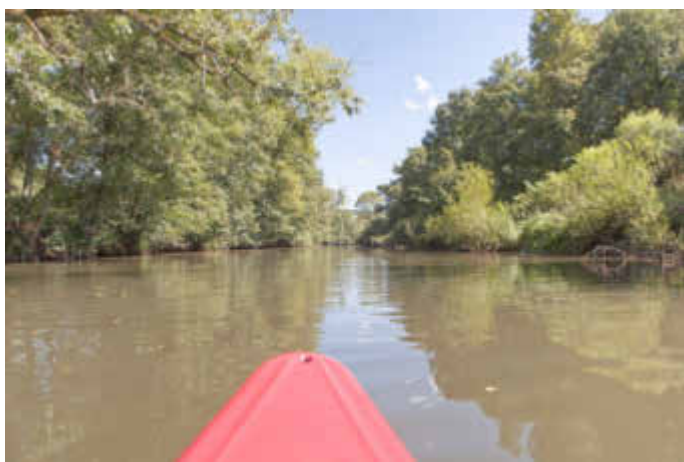
Kanu auf der Blies

Saarpfalz-Touristik, Paradeplatz 4, 66440 Blieskastel, Tel.: 06841 / 104-7174, Fax: 104-7175, E-Mail: touristik@saarpfalz-kreis.de