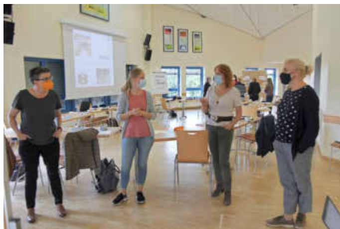
Gruppenarbeit zur Bestandsaufnahme und Bedarfsermittlung für Gesundheitsprävention in den Grundschulen.