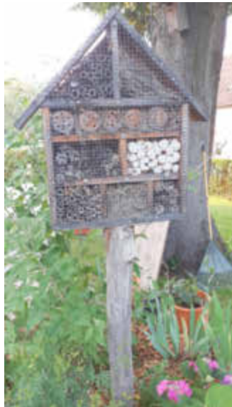
Ein während des Workshops gebautes Insektenhotel.

Damit sie ihre wichtigen Dienste als Bestäuber von Blüten leisten können, brauchen auch Insekten ein Dach über dem Kopf. Im Rahmen eines ganztägigen Workshops „Ein Hotel für Biene, Hummel und Co.“ erlernt man am 13. August von 10 bis 16 Uhr, wie man ein solches „Dach“ selbst bauen kann.