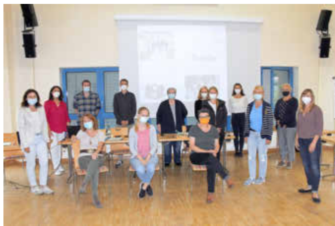
Die Akteure für „Familie plus - Zusammen gesund Leben in Familie und Schule“ trafen sich zur ersten Präsenzsitzung.