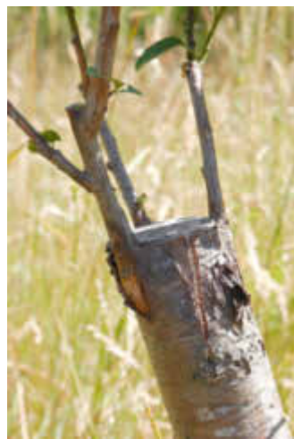
Beispiel für Gehölzschnitt

Gehölze selbst zu veredeln lernt man am 14. Juli ab 18 Uhr beim Workshop im Kulturlandschaftszentrum Haus Lochfeld in Wittersheim. Leiter des Kurses ist der Obst- und Gartenbauexperte Harry Lavall. Vielen Mitmenschen ist nicht bewusst, dass nahezu alle Obst- und Gartenbauexperte Harry Lavall. Vielen Mitmenschen ist nicht bewusst, dass nahezu alle Obst- und Gartenbauexperte Harry Lavall. Vielen Mitmenschen ist nicht bewusst, dass nahezu alle Obst- und Gartenbauexperte Harry Lavall.