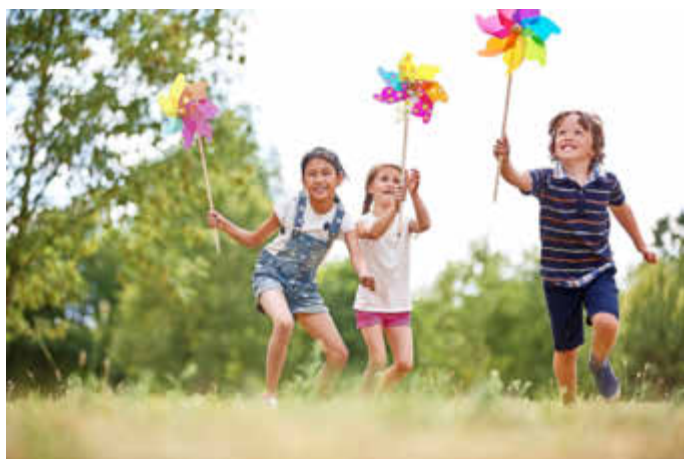
Bewegung ist insbesondere bei Schulkindern ein wichtiger Faktor, um Risikofaktoren wie Übergewicht entgegenzuwirken.