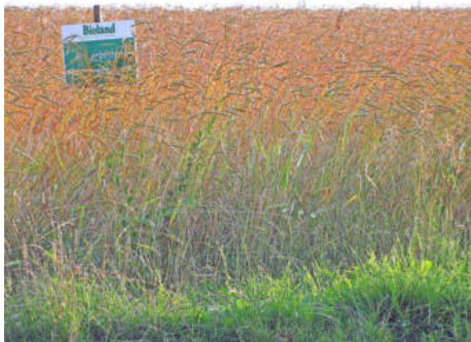
Biologische Landwirtschaft in der Biosphäre Bliesgau