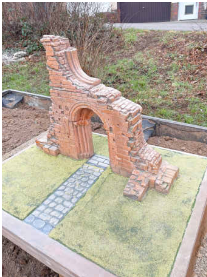
Ein Modell der Klosterruine Wörschweiler in der Entstehungsphase.