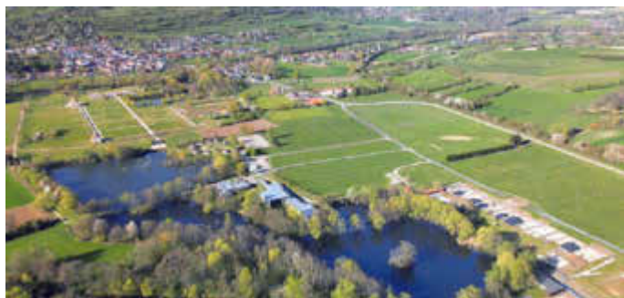
Ein Leuchtturmprojekt auf französischer und deutscher Seite: der Europäische Kulturpark Bliesbruck-Reinheim.

Das Département de la Moselle und der Saarpfalz-Kreis sind überzeugt, dass der Europäische Kulturpark Bliesbruck-Reinheim im Herzen Europas eine einzigartige, zukunftsweisende Einrichtung darstellt, die beitragen wird, den europäischen Gedanken weiter zu verwirklichen und zu leben.