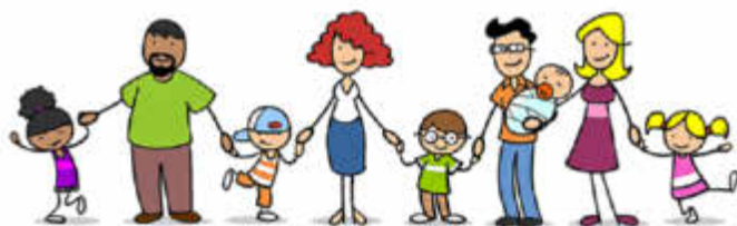
Cartoon-Patchwork-Familie mit vielen Kindern, die Händchen halten

Alle Interessierten erhalten nach ihrer Anmeldung einen Link mit dem Passwort, um an der Veranstaltung teilnehmen zu können. Anmeldungen zur Veranstaltung nimmt Tina Steinbrügger, Familienhilfzentrum Bexbach, unter der Telefonnummer 06841 / 104-8484 oder per E-Mail an Tina.Steinbruegger@saarpfalz-kreis.de entgegen. Bei Fragen zu allen Angeboten des Familienhilfzentrums Bexbach steht Silke Brosius unter der Tel. 06841 / 104-8488 gerne zur Verfügung.