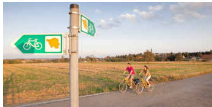
Hilfe bei der Planung und Erfassung von touristischen Radrouten Foto: Touristische Infrastruktur Radwege © TZS, Eike Dubois