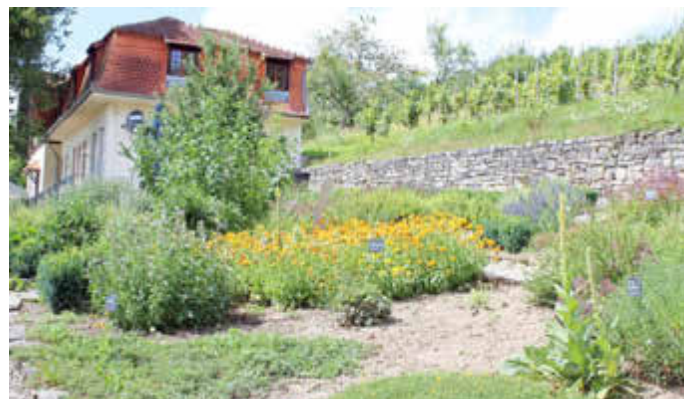
Arbeiten im Kräuter-, Bauern- und Obstgarten von Haus Lochfeld.

Weitere Informationen findet man auch beim Träger des FÖJ im Saarland, dem Ministerium für Umwelt und Verbraucherschutz.