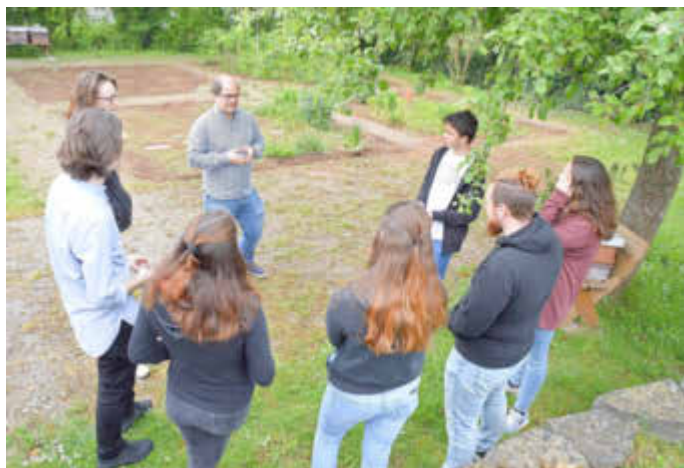
Ein Schwerpunkt der Partnerschaft für Demokratie sind Seminare für engagierte Jugendliche, hier ein Argumentationstraining im Ökologischen Schullandheim Spohns Haus in Gersheim im Jahr 2019.