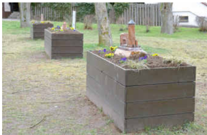
Im Garten der Sinne

Dahinter steckt die Idee, auch seh- und gehbeeinträchtigte Mitmenschen die historischen Denkmäler des Biosphärenreservats Bliessgau nahe zu bringen. Deshalb wurden mit viel Geduld und Liebe zum Detail maßstabsgerechte Modelle verschiedener regionaler Baudenkmäler hergestellt, die auf den Betonsockeln befestigt werden. Um die Modelle herum werden sukzessive duftende, aromatische und heilende Pflanzen ihren Platz finden. Tafeln mit Beschreibungen der als Modell dargestellten Sehenswürdigkeiten und der Pflanzen werden in Braille- und Druckschrift an den Kästen angebracht. Mit Rollstuhl oder Rollator kann man an die Installationen heranfahren und die Modelle haptisch erkunden, im wahrsten Sinne des Wortes begreifen. Wer sich im Garten der Sinne niederlässt, kann die Stille genießen und so auch seinem Gehörsinn etwas Ruhe gönnen.