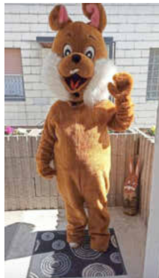
Der Osterhase im Einsatz.

Zumindest haben 150 Kinder und ihre Eltern nicht schlecht gestaunt, als am Ostersonntag der Osterhase vor ihrer Tür stand. Das hatte wohl niemand erwartet, als die Kinder bei der Osterhasenaktion der SPD Kirkel-Neuhäusel angemeldet wurden.