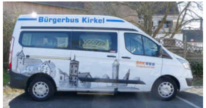
Der Bürgerbus im Einsatz.

Viele weitere Informationen finden Sie online auf unserer Webseite www.buergerbus-kirkel.de oder rufen Sie unseren Vorsitzenden Hans-Peter Schmitt an: Telefon Nr. 06849 / 714.